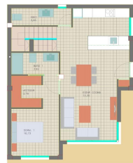
PLANTA BAJA GROUND FLOOR