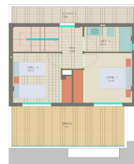
PLANTA ALTA TOP FLOOR