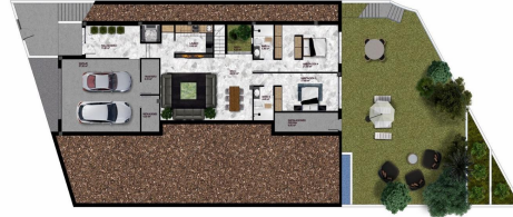
PLANTA SEMISÓTANO (1/150)