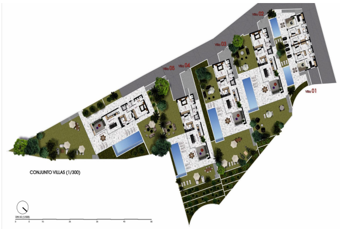
CONJUNTO VILLAS (1/300)